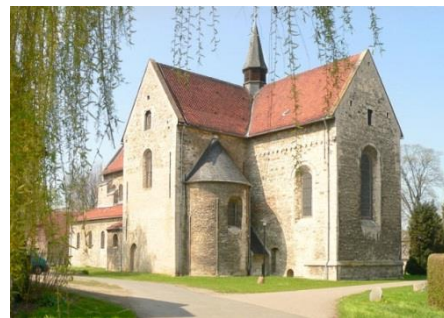
Templerkirche St. Johannes

mit Predigt und Abendmahl in ökumenischer Gemeinschaft