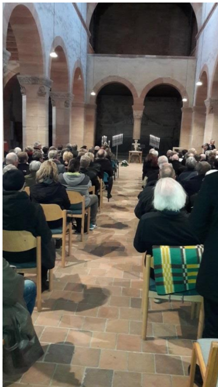
Kirchenschiff St. Petrus

Aussegnungsgottesdienst in St. Matthäus am 11. Oktober 2017 (Berlin, Potsdamer Platz) Beisetzungsgottesdienst in St. Petrus am 3. November 2017 (Petersberg)